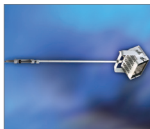
Pos.-Nr. 03-029 Halogenstrahler 230 V, 300 W, mit Auslegearm, weiß