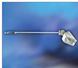
Pos.-Nr. 03-028 Halogenstrahler 230 V, 300 W, mit Auslegearm, weiß