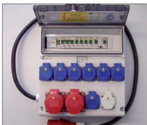
Pos.-Nr. 03-261 Mietverteiler 15-20 kW (inkl. Transport) 8 Schukosteckdosen 1 CEE 16 A Steckdose, 400 V