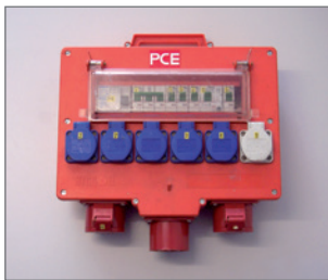
Pos.-Nr. 03-260 Mietverteiler 15-20 kW (inkl. Transport) 6 Schukosteckdosen 1 CEE 16 A Steckdose, 400 V