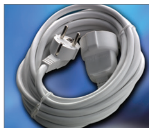
Pos.-Nr. 03-046 Schuko-Verlängerungskabel 230 V, 16 A, 5 m lang, weiß