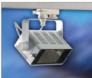
Pos.-Nr. 03-033 Halogenstrahler 230 V, 300 W, für Strahlschiene, weiß