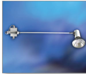
Pos.-Nr. 03-026 Klemmstrahler 230 V, 100 W, mit Auslegearm, weiß