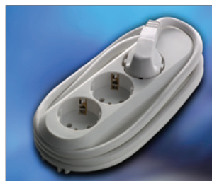
Pos.-Nr. 03-045 Tischsteckdose 230 V, 16 A, 3fach mit 1,5 m Anschlussleitung, weiß