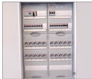
Pos.-Nr. 03-264 Mietverteiler 30-40 kW (inkl. Transport) 17 Schukosteckdosen 1 CEE 16 A Steckdose, 400 V