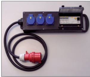
Pos.-Nr. 03-259 Mietverteiler bis 9 kW (inkl. Transport) 3 Schukosteckdosen