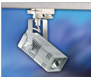
Pos.-Nr. 03-034 Niedervoltstrahler 12 V, 50 W, für Strahlschiene, weiß