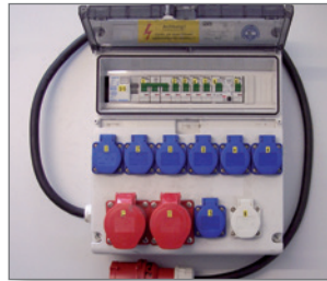
Pos.-Nr. 03-263 Mietverteiler 15-20 kW (inkl. Transport) 13 Schukosteckdosen 1 CEE 16 A Steckdose, 400 V