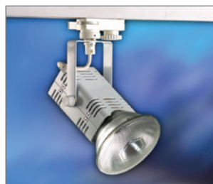
Pos.-Nr. 03-031 Strahler 230 V, 100 W für Strahlschiene, weiß,