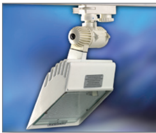
Pos.-Nr. 03-032 Halogenstrahler 230 V, 300 W, für Strahlschiene, weiß