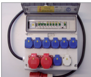
Pos.-Nr. 03-262 Mietverteiler 15-20 kW (inkl. Transport) 10 Schukosteckdosen 1 CEE 16 A Steckdose, 400 V